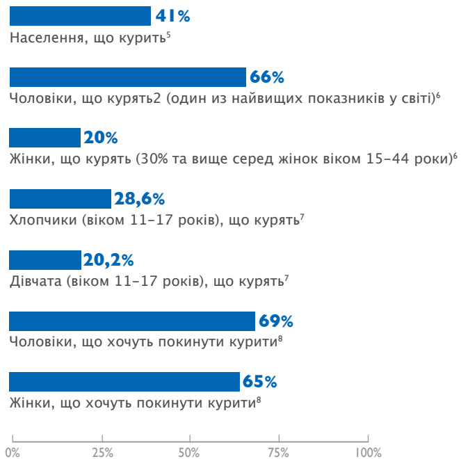
Мал. 1: Вживання тютюнових виробів в Україні (2005)