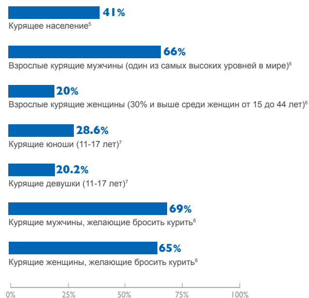
Рисунок 1: Потребление табака на Украине (2005 г.)